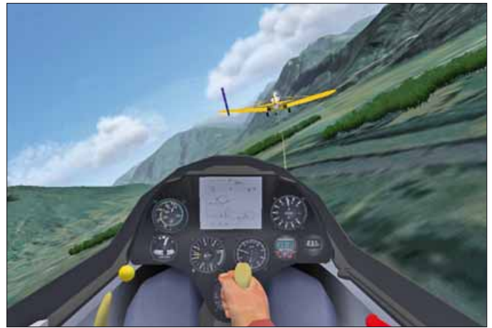
Ob Schulung, Kunst- oder Wettbewerbsflug. Im Condor sind all diesen fliegerischen Aktivitäten kaum Grenzen gesetzt